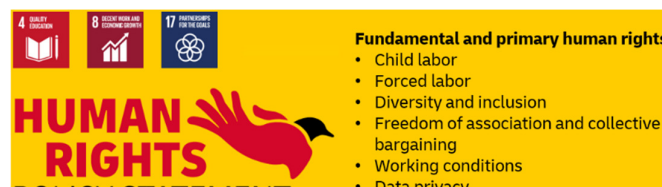
Figur 2: Human Rights Policy Statement

Vi respekterer personvernet til alle enkeltpersoner og konfidensialiteten til personlige data vi har om dem. DHL Groups personvernerklæring gir passende sikkerhetstiltak for overføring av personopplysninger som tilhører ansatte, kunder og leverandører innen DHL Group. DHL Groups styring av databeskyttelse ivaretar overholdelse av de respektive databeskyttelsesforskriftene og -lovverkene. Ansvar for gjennomføringen av disse retningslinjene overvåkes av styret til DHL Supply Chain (Norway) AS. Dette sikrer at virksomheten er tydelige når det gjelder ansvaret for å respektere menneskerettighetene og den daglige gjennomføringen av dem.