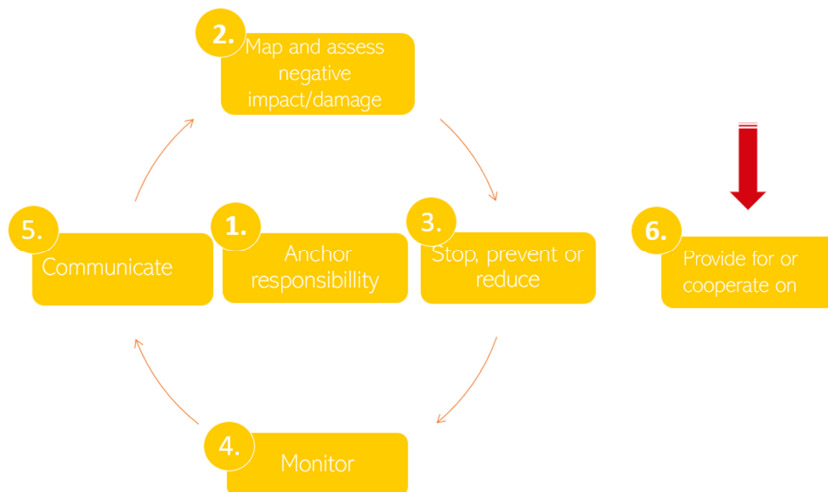
Figur 1: OECD Hjulet av Due Diligence

Loven gjelder også utenlandske bedrifter som er skattepliktige i Norge, totalt ca. 9000 bedrifter. Loven krever at selskapene publiserer en rapport offentlig med informasjon om hvordan selskapet jobber med loven, funnene de har gjort, og hvordan de jobber med eventuelle negative konsekvenser. Åpenhetsloven fastsetter forpliktelsen til å utføre aktsomhet i henhold til menneskerettigheter i samsvar med OECDs retningslinjer for multinasjonale selskaper.