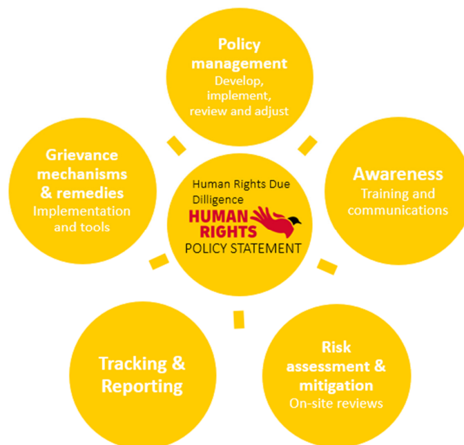
Figur 4: Human Rights Policy Statement

Konsernet har et administrasjonssystem for menneskerettigheter for å sikre ensartet implementering av prinsippene våre i hele konsernet, som beskrevet i erklæringen vår for menneskerettigheter («Human Rights Policy Statement») og visualisert i figur 4.