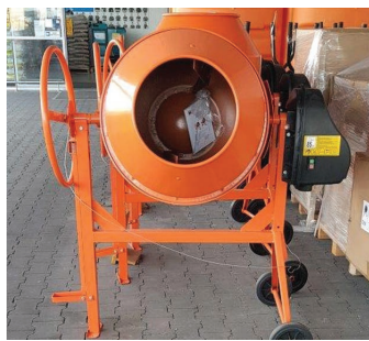
Przesyłka nie została umieszczona na palecie i przymocowana do niej; brak zabezpieczenia z zewnątrz