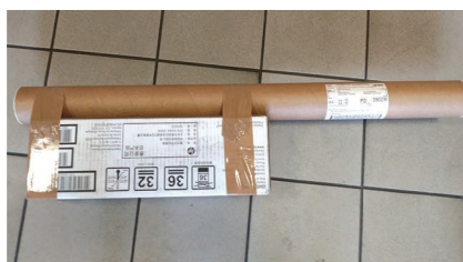
Poszczególne paczki wchodzące w skład przesyłki powinny znaleźć się w większym, odpowiednio zabezpieczonym kartonie z wypełnieniem