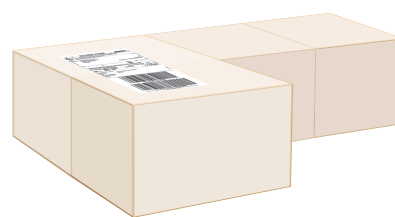
Pudełko kartonowe w ściśle przylegającej folii