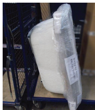
Przesyłka w całości nie została opakowana w karton przez co narażona jest na uszkodzenie