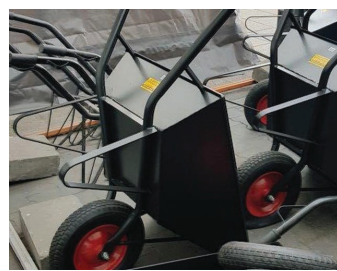
Przesyłka nie została opakowana w karton, ani w żaden sposób zabezpieczona z zewnątrz