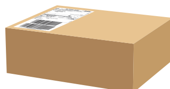
Pudełko kartonowe o kształcie prostopadłościanu