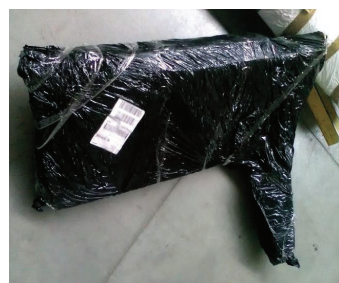
Przesyłka nie została opakowana w karton oraz posiada wystający element, który może uszkodzić inne przesyłki