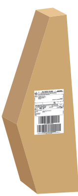
Opakowanie kartonowe o nieregularnym kształcie, bez ostrych krawędzi i wystających elementów