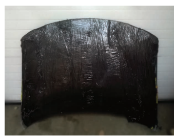
Przesyłka nie została opakowana w karton, a wewnętrzne zabezpieczenie transportowanego elementu jest niewystarczające (dotyczy to wszystkich części samochodowych)